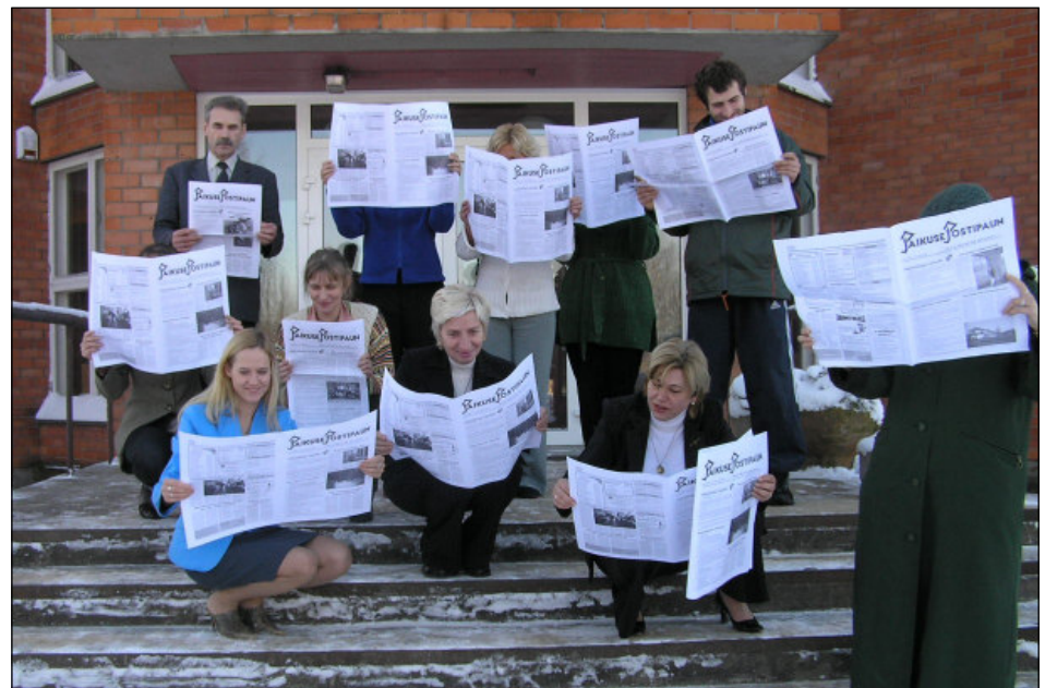
Paikuse Postipauna ilmumine on igale vallakodanikule sündmus omaette. Pole tähtis, kus või millal see näppu satub, lugema hakatakse seda alati kohe.