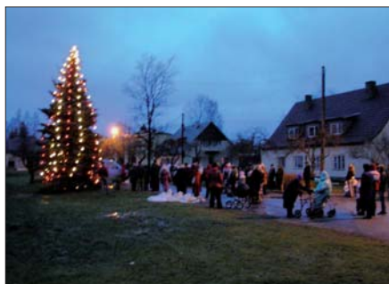
Paikuse Vallavolikogu ja -valitsus

Ligi sajale 80 aastasele ja vanemale vallakodanikule viivad sotsiaaltöötajad koju kätte jõulutervitustega kaardikese 100 krooniga.