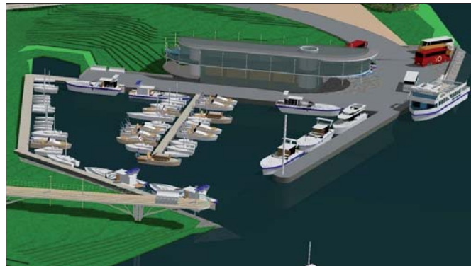
Sellisena näeks välja sadam vaadatuna sillalt Reiu jõe

na tehnoõrgud ja liiklus. Käesolev detailplaneering baseerub varasemal ja planeeritud infrastruktuuriga liitumisele sujuvalt.