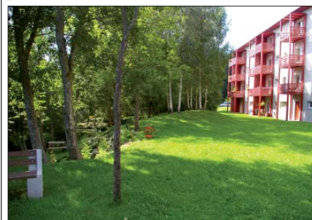
Pärnade pst 14

Vallamaja fuajees saab vähemalt kuu lõpuni vaadata värskest tehtud fotosid veesilmadest, mängumajadest, lillepeenardest, üksikobjektidest – ühesõnaga koduvalla ilusatest aedadest ja majadest.