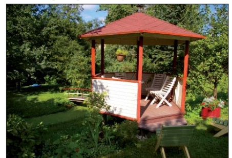
Ojakalda tn 11