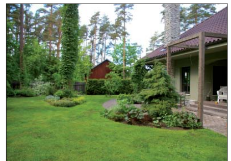
Toomingu tn 8

OÜ Tammuru Puit – 2010. aastal enim töökohti loonud ettevõtja vallas