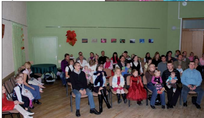
Viimasel beebipäeval oli kohal 36 pisipoissi ja -tüdrukut