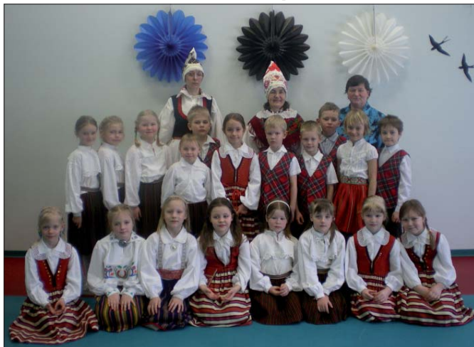
Kaks vanimat paralleelrühma olid kauneis rahvariideis.