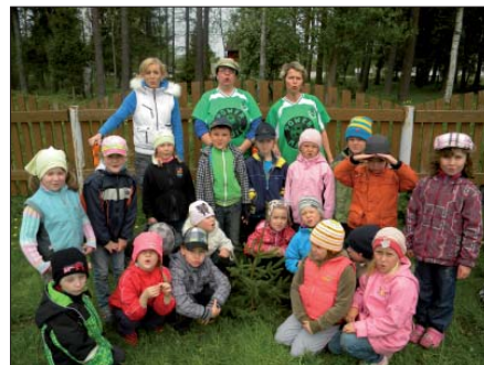
Sinilille rühm oma kasvatajate ja metsapäeva män- gujuhiga