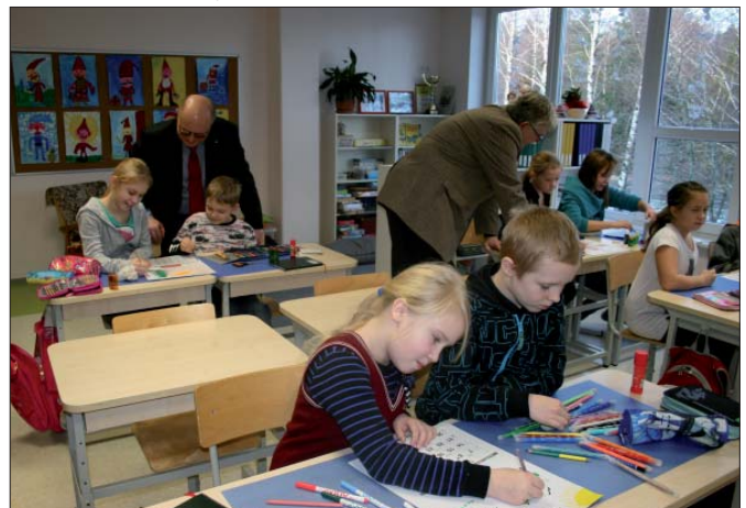
Haridus- ja Teadusministeriumi delegatsioon uuendamas 3 a klassi tööpetuse tunnisi Paikuse Põhikoolis, kuidas valmivad kalendrid