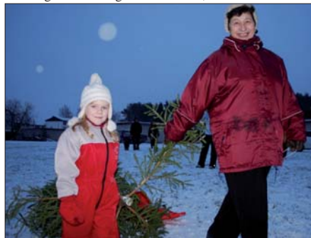
4. aastane Heleriin koos vanaemaga

Tänavune ilm soosis üritust igati ja lasi lastel kõrvaloleval liumäel ka kelgutades lustida.